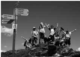
Camps d'enfants à Gsteig (BE)

A la fin 2012, 360 enfants suisses de l'étranger ont profité des offres de séjour de la Fondation pour les enfants suisses à l'étranger. Ce nombre réjouissant de participants n'a pu être accueilli que grâce au bel engagement des membres des comités cantonaux et du Conseil de Fondation ainsi qu'à des collaborateurs et collaboratrices dévoués. Nous tenons à les remercier tous chaleureusement.