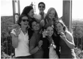
Participants à l'excursion aventure

En 2012, près de 300 adolescents ont passé leurs vacances en Suisse en participant à un programme de l'OSE. Cette dernière propose en effet aux jeunes Suisses de l'étranger de découvrir leur patrie et de nouer des liens avec d'autres jeunes et avec la Suisse. L'offre destinée aux jeunes est d'excellente qualité, très avantageuse et aussi très appréciée et plébiscitée par les jeunes Suisses de l'étranger. Les retours de la part des jeunes, de leurs parents comme de nos partenaires sont très positifs. L'équipe des moniteurs et les familles d'accueil font un travail formidable, bénévolement, et y mettent du cœur.