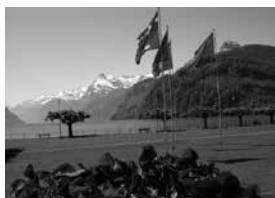
Place des Suisses de l'étranger, Brunnen