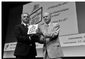
5. Remise d'une pétition au conseiller fédéral Didier Burkhalter

L'introduction générale d'un système de vote électronique fait partie des principales requêtes actuelles de l'OSE. A chaque élection, les insuffisances du procédé de vote par correspondance se font de nouveau criantes. A l'inverse, toutes les tentatives menées