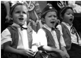
L'école suisse de Cuernavaca fêtant ses 20 ans

Les 17 écoles suisses à l'étranger offrent une formation scolaire de haute qualité calquée sur le modèle suisse. Elles sont reconnues et subventionnées par la Confédération. Là où il n'y a pas d'écoles suisses, mais où existe une réelle demande de parents suisses, des enseignants suisses insèrent un élément suisse dans le quotidien pédagogique d'écoles gérées par des pays voisins. Par ailleurs, la Confédération contribue financièrement – ici aussi, sur demande de parents suisses – à des cours de langues et culture suisses, ainsi qu'à l'achat du matériel d'enseignement.