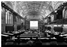
Séance CSE Lausanne

Au cours de l'année, le Conseil des Suisses de l'étranger s'est rassemblé comme d'habitude lors de deux sessions d'une journée, en mars à Berne, capitale fédérale, et en août à Lausanne dans le cadre du 90 e Congrès des Suisses de l'étranger. L'organe représentatif