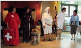
Verkleidet für das Jubiläumsquiz!

wechslungsreich und für Jedermann. Es wurde auch ein Beitrag zum Thema „Heimat“ verfasst und vorgetragen und die Ehrenpräsidentin und Gründerin des Schweizerklubs erzählte über die Entstehung und den Anfang. Was wäre so ein schöner Jubiläumsanlass ohne ein Quiz mit Fragen über die Schweiz? Mitglieder verkleideten sich als berühmte Schweizer Persönlichkeiten aus Geschichte und Sport. Dazu gab es noch einige Fragen und nun durfte fleissig geraten werden. Auf der Bühne standen in tollen Kostümen, der Schellenursli, Roger Federer,