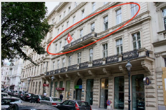
Schweizerische Botschaft in Österreich, 1010 Wien, Kärntnerring 12.

Das Eidgenössische Departement für auswärtige Angelegenheiten EDA hat beschlossen, die konsularischen Dienstleistungen (Ausweise, Visa, Zivilstandsangelegenheiten, An- und Abmeldungen etc.) für Kroatien, Slowakei, Slowenien, Tschechien und Ungarn in Zukunft von Wien aus zu betreuen. Zu diesem Zweck ist am 3. Oktober 2011 das Regionale Konsularcenter (R-KC) Wien in den