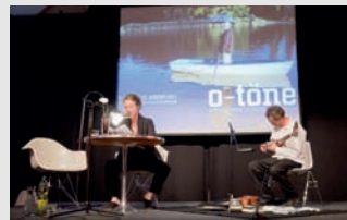
Melinda Nadj Abonji und Balts Nill

Die Schweizerische Schriftstellerin Melinda Nadj Abonji, Trägerin des Deutschen und des Schweizer Buchpreises 2010, hat am 14. Juli 2011 aus Ihrem Erfolgsroman „Tauben fliegen auf“ im Museumsquartier Wien gelesen. Abonjis Auftritt fand im Rahmen der durch die Botschaft organisierten Schweizer Beteiligung am 10-jährigen Jubiläum des Museumsquartier Wien statt. Begleitet wurde die Lesung vom Berner Percussionist Balts Nill. Die beiden Schweizer begeisterten die rund 400 Gäste mit ihrer witzigen und hoch qualitativen Performance. Die Lesung war Teil des jährlich in Wien stattfindenden Literaturfestivals O-Töne.