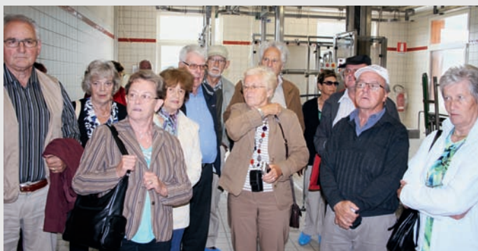
Sauris, Schinkenfabrik – unsere staunenden Vereinsmitglieder