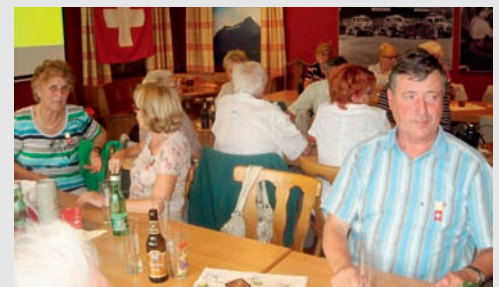
In gemütlicher Runde wurden verschiedene Biere degustiert.