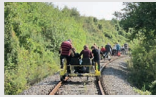
Draisenfahrt im schönen Weinviertel.

Nachdem letztes Jahr das Draisenfahren im Burgenland viel Spass gemacht hat, haben wir auf vielseitigen Wunsch erneut eine Draisenfahrt organisiert, und zwar im Weinviertel. Dieses Mal ging's von Ernstbrunn nach Asparn. In dieser lieblichen Landschaft, die stark an die Toscana erinnert, traten wir in die Pedale. Es ging rauf und runter, eine Strecke von 12,5 km, die wir auch wieder zurückfahren mussten. Der Spass war gross, die Anstrengung eben-