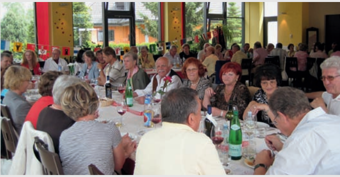
Ein wunderschönes Fest zum 10-jährigen Jubiläum.

wechslungsreich und für Jedermann. Es wurde auch ein Beitrag zum Thema „Heimat“ verfasst und vorgetragen und die Ehrenpräsidentin und Gründerin des Schweizerklubs erzählte über die Entstehung und den Anfang. Was wäre so ein schöner Jubiläumsanlass ohne ein Quiz mit Fragen über die Schweiz? Mitglieder verkleideten sich als berühmte Schweizer Persönlichkeiten aus Geschichte und Sport. Dazu gab es noch einige Fragen und nun durfte fleissig geraten werden. Auf der Bühne standen in tollen Kostümen, der Schellenursli, Roger Federer,