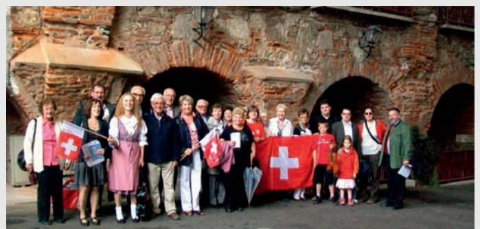
Die Sängertuppe in den Kasematten