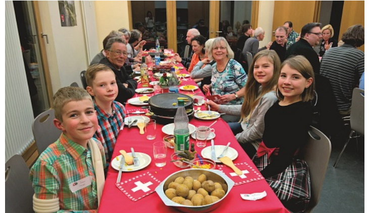
Wiesbadener Schweizer feuern in der Coface Arena in Mainz die Mannschaft von Martin Schmidt an (links). Fröhliches Raclette-Essen am 27. Februar (rechts)

welche von nah und fern, mit Schweizer und Walliser Fahnen sowie teils mit Kuhglocken anreisen. Es wurden auch schon Fahnen-schwinger und eine traditionelle Jodelgruppe beim Fussballspiel gesehen. Martin Schmidt ist auf dem besten Weg in Mainz, über den Rhein in Wiesbaden und im Wallis Fussballgeschichte zu schreiben.