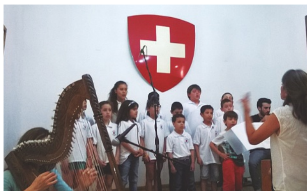
Coro de Niños Mundo Sonoro