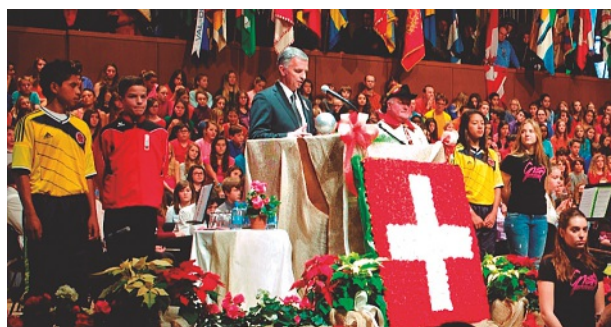
Didier Burkhalter con los jóvenes de Colombia/diciembre de 2013

Para los jóvenes deportistas colombianos, es toda una ex-