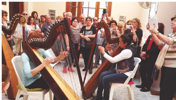
EVA en la Sociedad Suiza de Paysandú

evargentina2007@hotmail.com.ar (CONSEJO DIRECTIVO EVA)